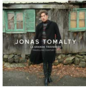
TRAVELLING CENTRURY 2021