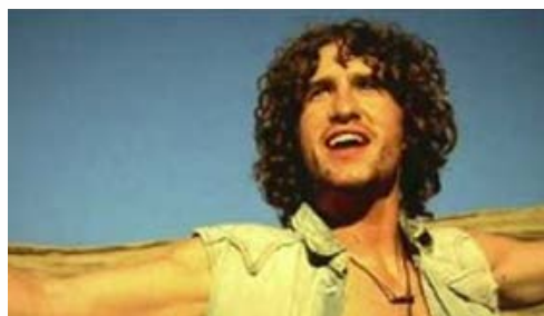
EDGE OF SEVENTEEN 89 VUES