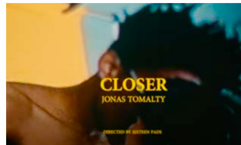
CLOSER 22K VUES