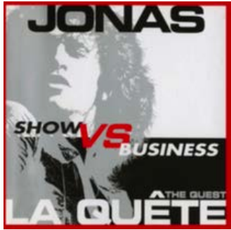
LA QUÊTE 2007