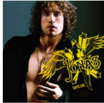
SUITE LIFE 2006