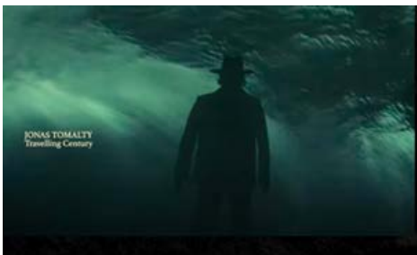
TRAVELLING CENTURY 22K VUES