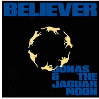
BELIEVER NEW SINGLE 2024